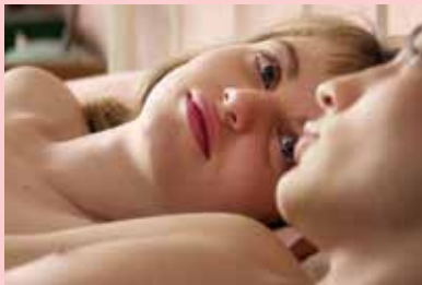
Trois souvenirs de ma jeunesse d'Arnaud Desplechin

あの頃エッフェル塔の下で Trois souvenirs de ma jeunesse d'Arnaud Desplechin