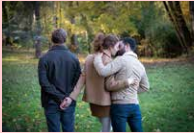
Les Choses qu'on dit, les choses qu'on fait