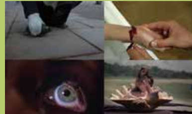
Ne croyez surtout pas que je hurle de Frank Beauvais