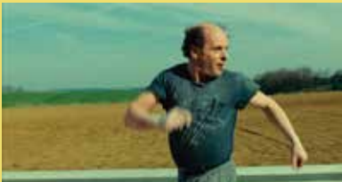
Peaux de vaches