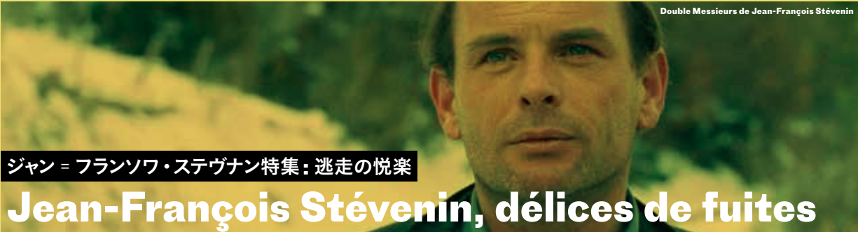
Double Messieurs de Jean-François Stévenin