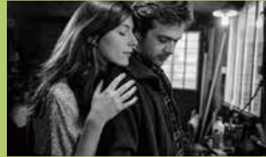
Le Sel des larmes de Philippe Garrel