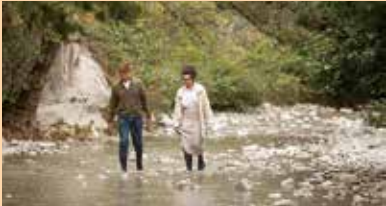
Les Choses qu'on dit, les choses qu'on fait