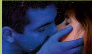
Vif-argent de Stéphane Batut