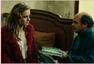
Peaux de vaches

フランスの映画媒体、批評家、専門家、プログラマーと協力し、最新の、あるいは知られざるフランス映画を選りすぐり紹介する特集「映画批評月間」。第3回目となる今回は、ゴダール、トリュフォーらヌーヴェルヴァーグの映画監督を輩出したことでも有名なフランスの映画雑誌「カイエ・デュ・シネマ」の新編集長マルコス・ウザルと共に行ったセレクションでお届けします。新世代の映画作家として、それぞれコメディというジャンルの中で独創的な作品を生み出し、注目されているソフィー・ルトゥルヌールとエマニュエル・ムレのふたりを特集します。発見すべき映画作家としては、ヌーヴェルヴァーグの監督たちの助監督、俳優を務め、「フランスのイーストウッド」(デプレシャン)とも評されるジャン＝フランソワ・ステヴナンの監督作品を特集。また「カイエ・デュ・シネマ」が今年70周年を迎えるのを記念し、同誌で編集長を務め、1992年に他界してからも、映画を作る、思考する者たちに圧倒的な影響を誇るセルジュ・ダネーを巡る上映、トークを開催します。