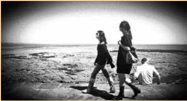
Le Marin masqué

教師をしているクレマンは、ひよんな事から、大ファンだった有名女優アリシアと付き合うことに。順調に見えたアリシアとの付き合いだが、カプリスという若い女性が登場し、複雑な展開に…。『アリスと市長』などで高く評価されている若手女優no.1の誉れ高いドゥームースティエと、ポール・ヴァンホーヴェンとの新作『ベネデッタ』が待ち望まれるこちらもうな女優エフィラ、その二人が演じる魅力的な女性の間で揺れ動く内気な男性をムレ自身が演じるチャーミングなラブコメディ。