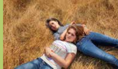
Adolescentes de Sébastien Lifshitz