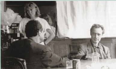
Jacques Rivette, le veilleur (Cinéma, de notre temps)

「デュトロン演じるヴァン・ゴッホを「取り囲む」登場人物たちがあれほどすばらしく、私たちが彼らを驚くほど無償で愛してしまったのは、まさに映画の登場人物を定義する法則のひとつ、文字で書かれることのないその痕跡を彼らが備えているからだ。すなわち「それだけしかすることがないわけではない」人たち。ガシェ医師がいきなり冒頭から、スケジュールをやり繰りするのになにより悪戦苦闘しているところや、足を怪我してしまうまで、店をしっかりと切り盛りしているピストロの女主人を私は愛する。オーヴェルに頻繁に来ることがない(別の人生がある)テオも好きだし、「最後の一杯」をもらうため戸口にいつも立っている父と息子、素晴らしき酔っぱらいたちも大好きだ」―― セルジュ・ダネー(『トラフィック』2号)